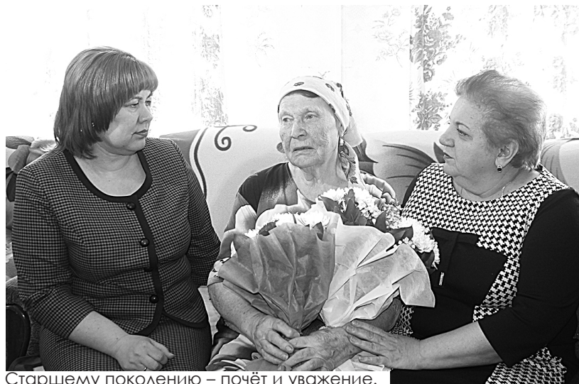
Старшему поколению – почёт и уважение.