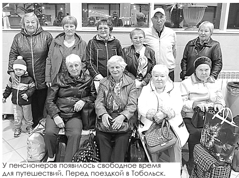
У пенсионеров появилось свободное время для путешествий. Перед поездкой в Тобольск.

Мы не бросаем и тех своих пенсионеров, кто переехал в Тюменскую область. Они получают прибавку к пенсии, а также отдельные выплаты к праздничным датам. Это справедливо: ведь эти люди