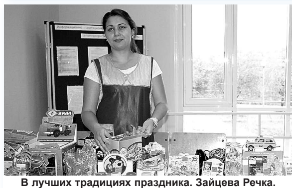
В лучших традициях праздника. Зайцева Речка.