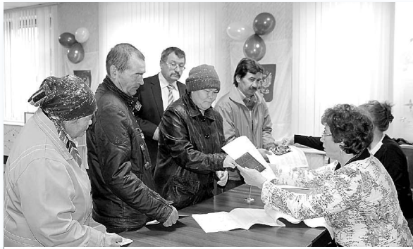
Ранние избиратели в Агане.