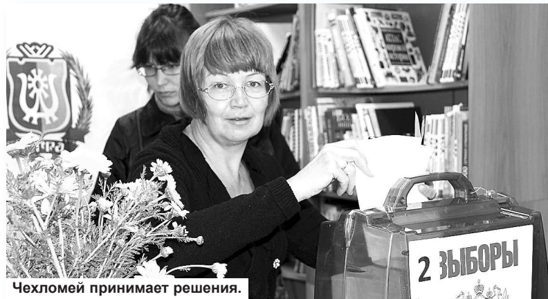
Челомей принимает решения.