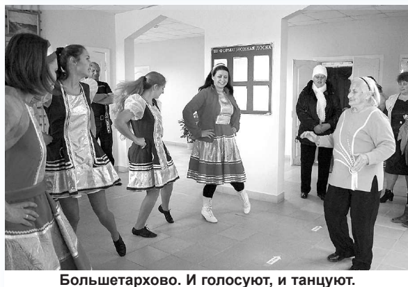
Большетархово. И голосуют, и танцуют.