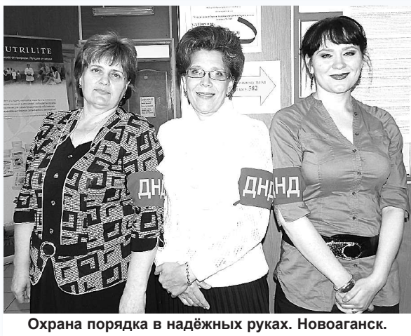
Охрана порядка в надёжных руках. Новоаганск.