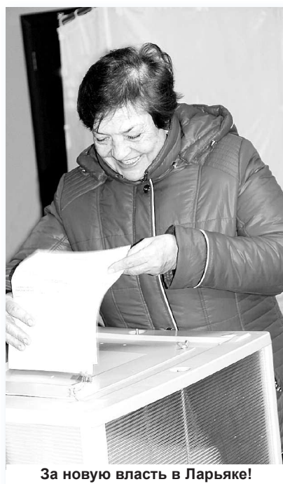
За новую власть в Ларьяке!