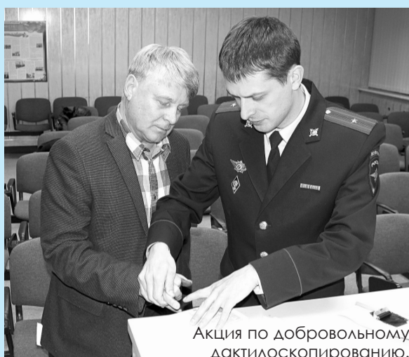
Акция по добровольному дактилоскопированию.