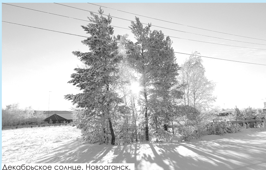
Декабрьское солнце. Новоаганск.