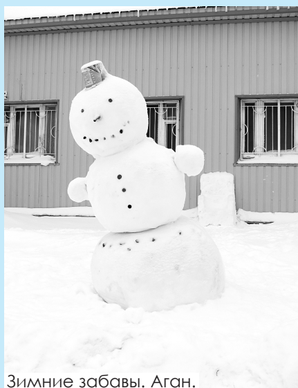
Зимние забавы. Аган.