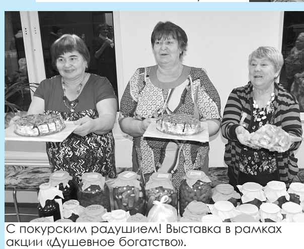
С покурским радушием! Выставка в рамках акции «Душевное богатство».