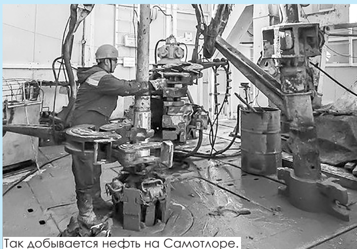
Так добывается нефть на Самотлоре.