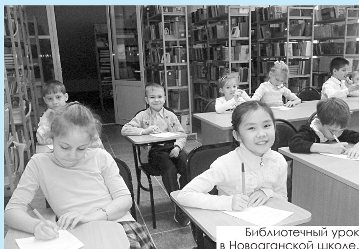
Библиотечный урок в Новоаганской школе.