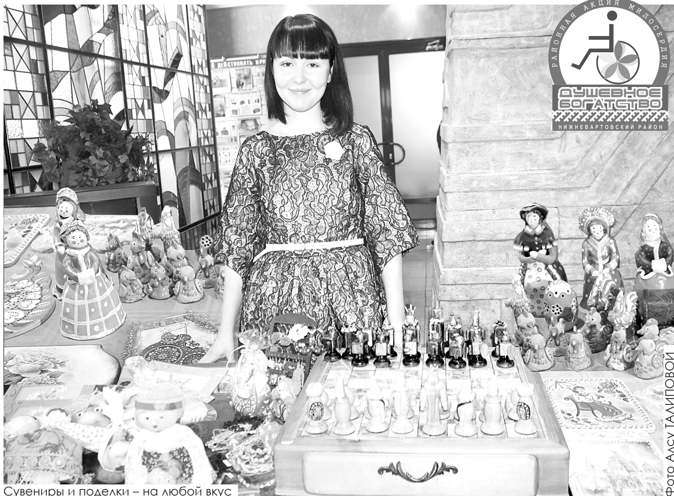
Сувениры и поделки – на любой вкус