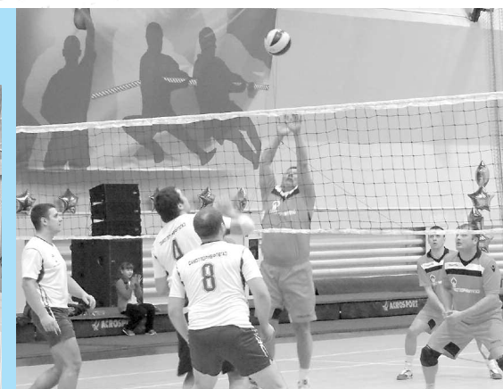
Волейбольные баталии в Излучинске.