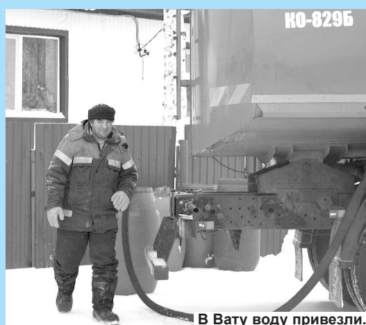
В Вату воду привезли.