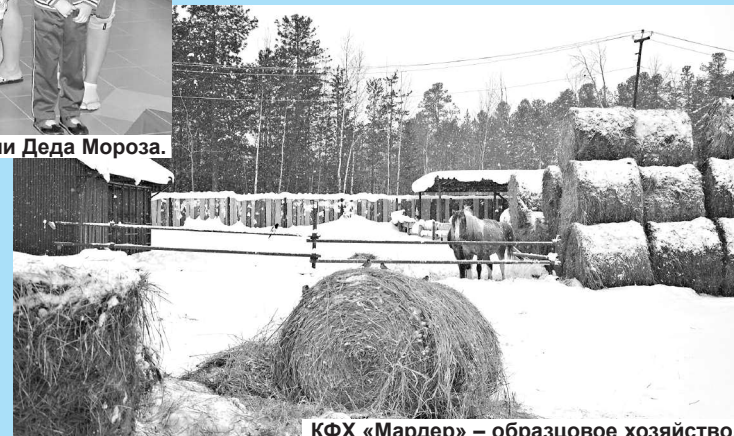
КФХ «Мардер» – образцовое хозяйство.