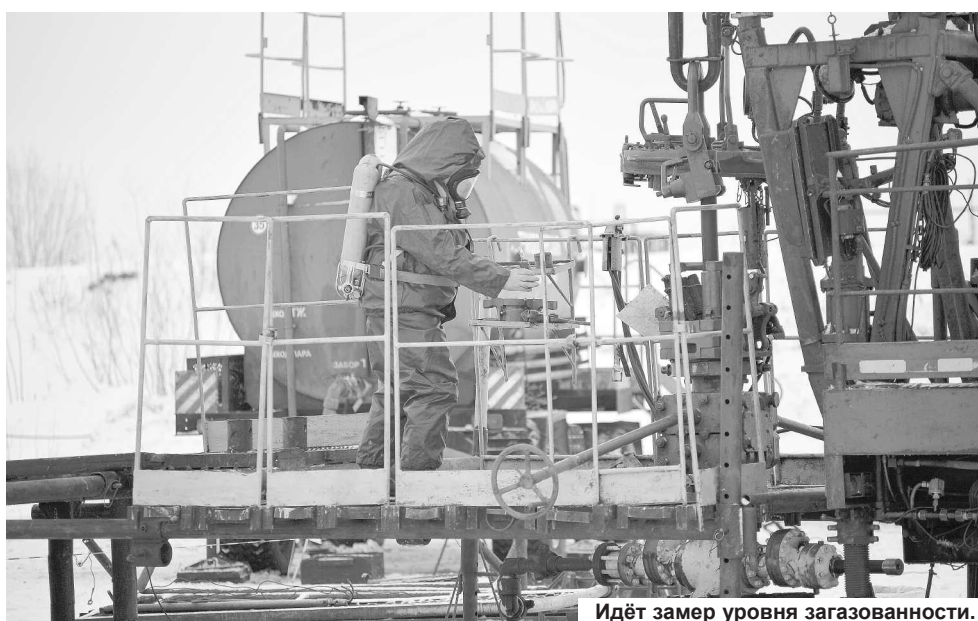
Идёт замер уровня загазованности.