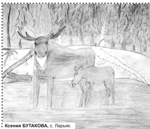
Ксения БУТАКОВА, с. Ларьяк.