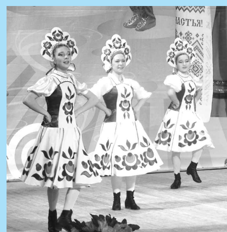
Танцевали, Год культуры закрывали. Новоаганск.