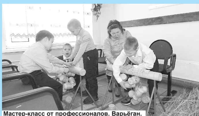
Мастер-класс от профессионалов. Варьёган.