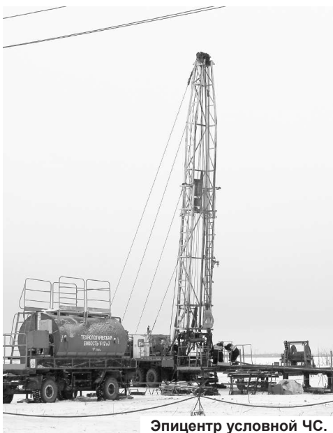
Эпицентр условной ЧС.