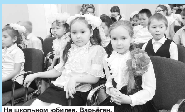
На школьном юбилее. Варьёган.