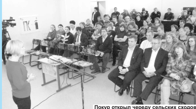
Покур открыл череду сельских сходов.