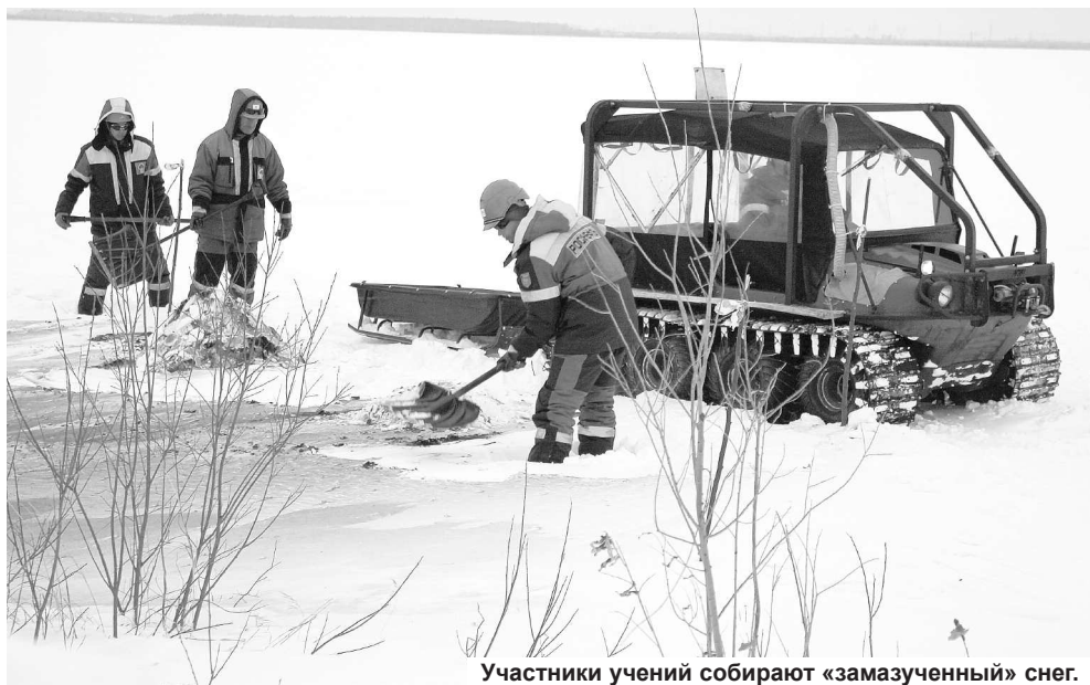
Участники учений собирают «замазученный» снег.

Непосредственное участие в КШУ приняли более 50 рабочих и специалистов. На месте аварии действовал подвижный пункт управления, в составе которого 10 представителей оперативного штаба предприятия и другие специалисты. Таким образом, число участников учения превысило 70 человек.