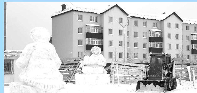
Будет в Излучинске снежный городок.