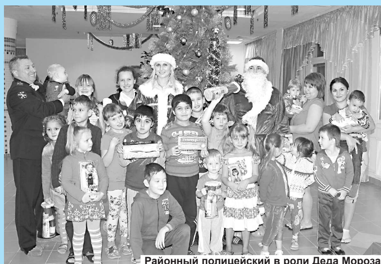
Районный полицейский в роли Деда Мороза.