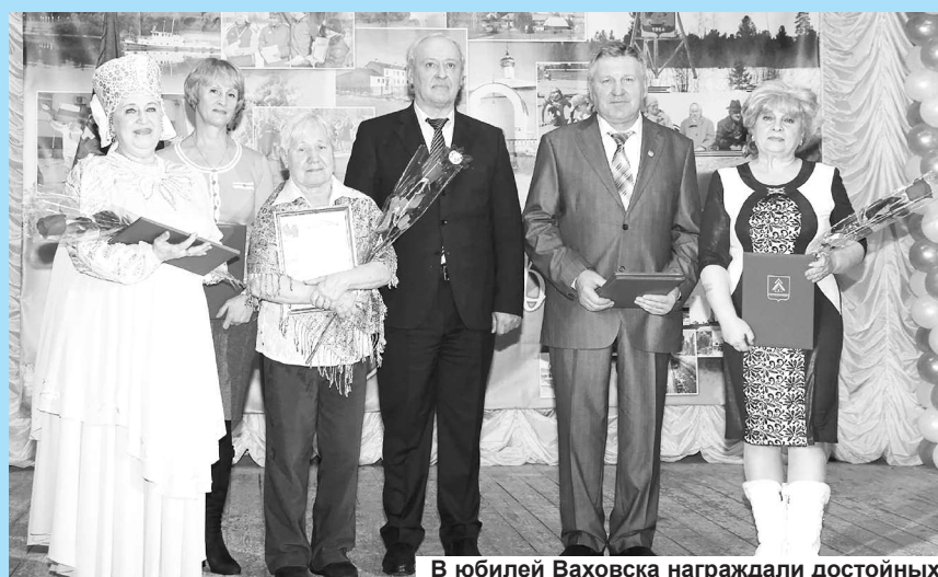
В юбилей Ваховска награждали достойных.