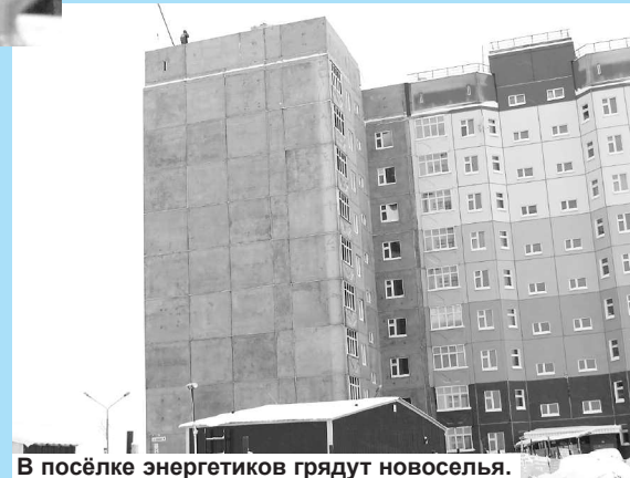
В посёлке энергетиков грядут новоселья.