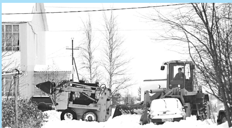
Уборка снега в Новоаганске.