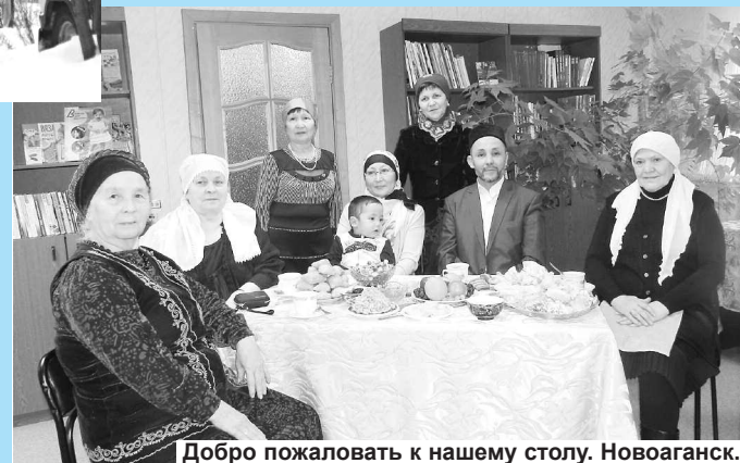
Добро пожаловать к нашему столу. Новоаганск.