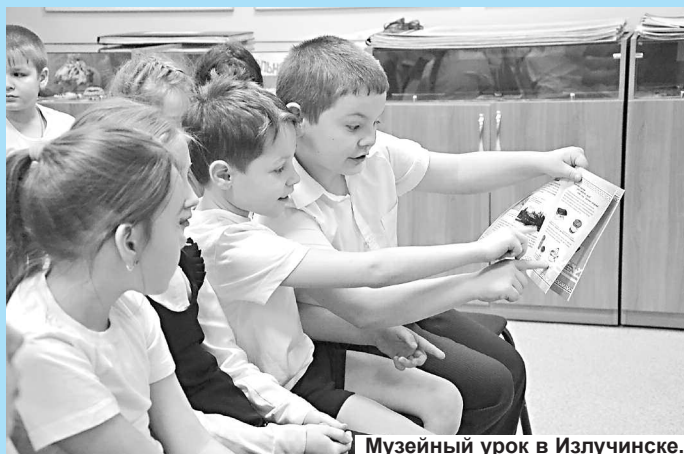
Музейный урок в Излучинске.