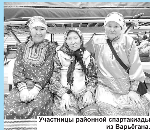
Участницы районной спартакиады из Варьёгана.