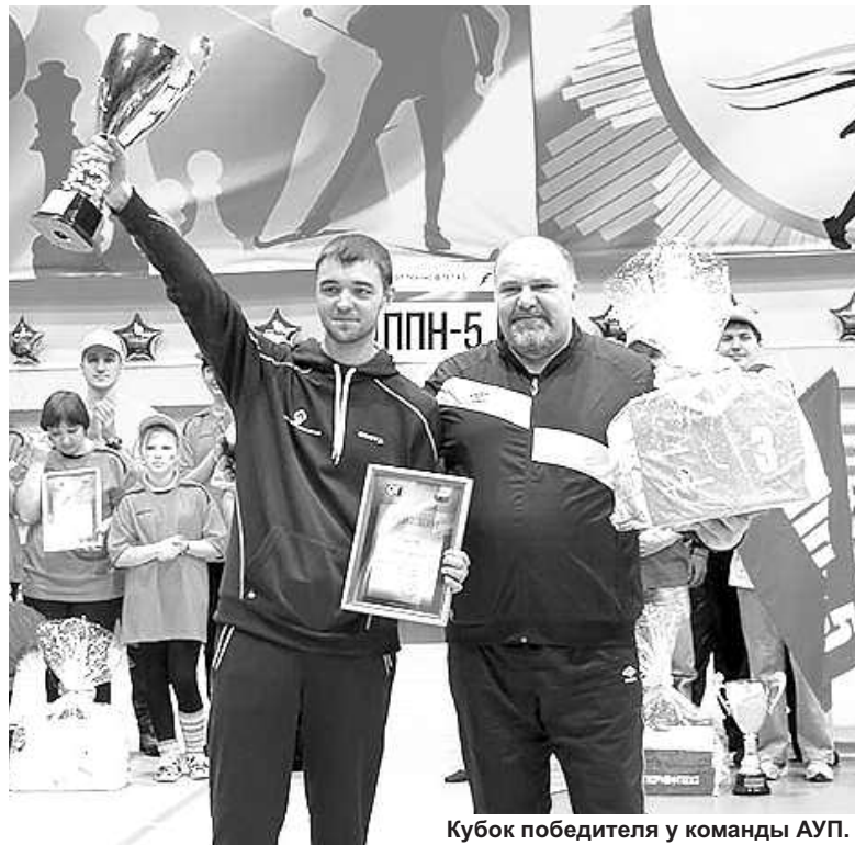
Кубок победителя у команды АУП.