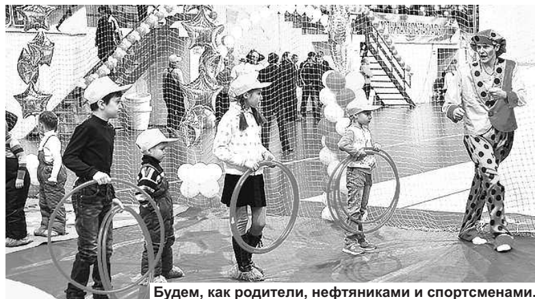
Будем, как родители, нефтяниками и спортсменами.

спорт – это залог наших трудовых побед, хорошего настроения и здорового образа жизни. Желаю всем участникам соревнований показать красивую и честную борьбу, а болельщикам – побольше активной поддержки спортсменов».