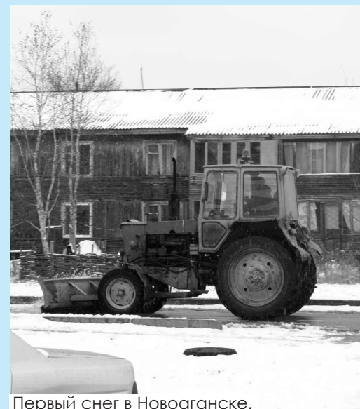
Первый снег в Новоаганске.