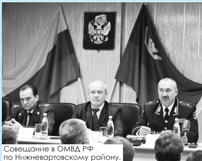
Совещание в ОМВД РФ по Нижевартовскому району.