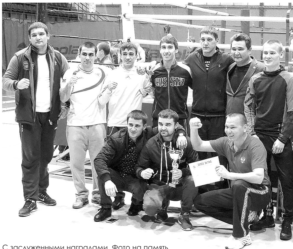
С заслуженными наградами. Фото на память.

Вернуть живой интерес к боксу среди юных соотечественников – это одна из задач, которую поставили перед собой во Всероссийской федерации бокса. Именно в этом ключе были выдержаны соревнования в Излучинске. Своё веское слово сказали на них и представители Всероссийского физкультурно-спортивного общества «Динамо». Бокс был и должен оставаться в числе приоритетных видов спорта – таково общее мнение всех специалистов, собравшихся в Излучинске. В Нижневартовском районе это мнение разделяют и всемерно поддерживают.