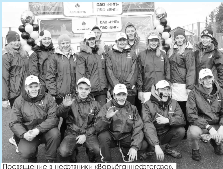
Посвящение в нефтяники «Варьёганнефтегаза».