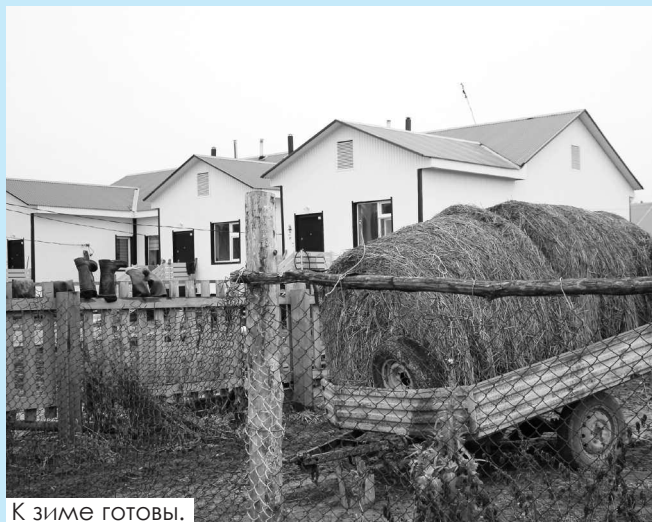
К зиме готовы.