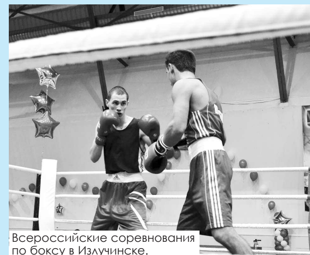
Всероссийские соревнования по боксу в Излучинске.