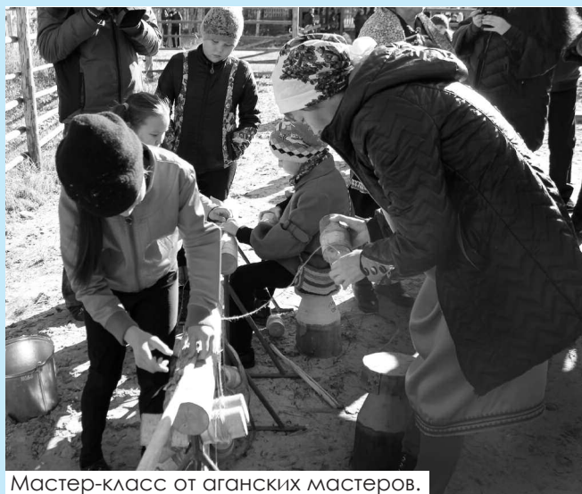
Мастер-класс от аганских мастеров.