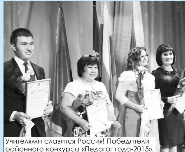
Учителями славится Россия! Победители районного конкурса «Педагог года-2015».