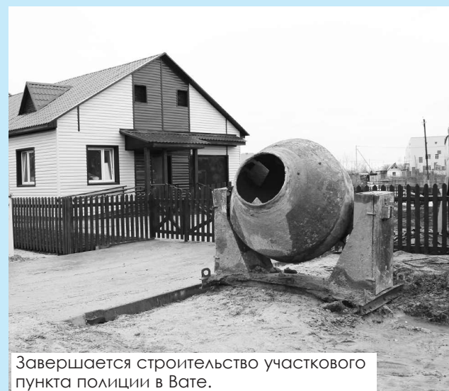
Завершается строительство участкового пункта полиции в Вате.