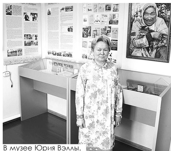
В музее Юрия Вэллы.

То, что мы планируем в ближайшее время начать, это проект по смешанной застройке Излучинска площадью 10 тысяч квадратных метров. Земельные участки нами предоставлены, подве-