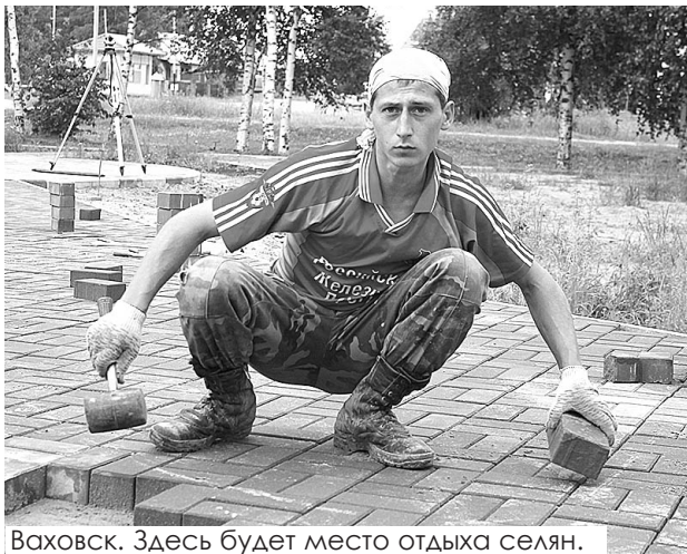
Ваховск. Здесь будет место отдыха сельян.