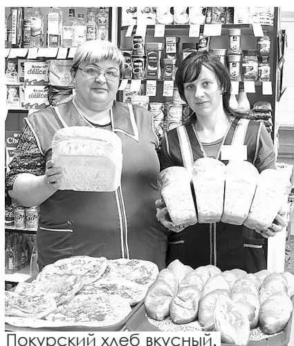
Покурский хлеб вкусный.