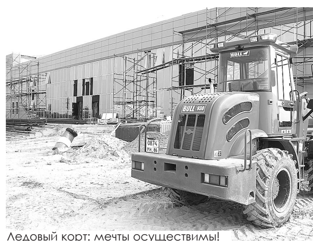
Ледовый корт: мечты осуществимы!