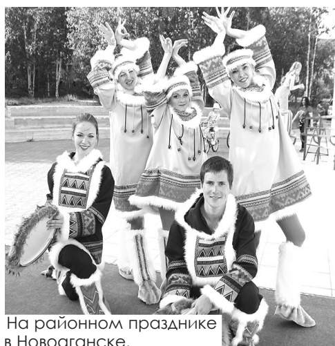
На районном празднике в Новоаганске.