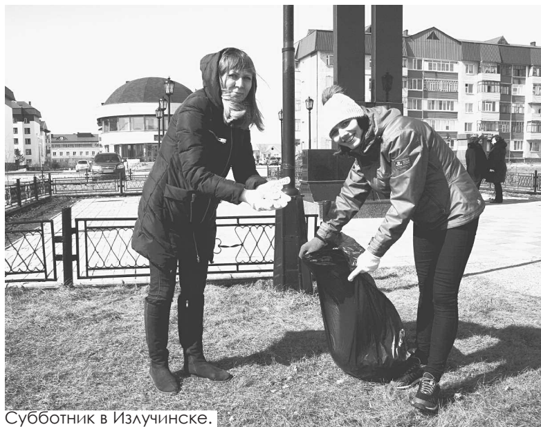
Субботник в Излучинске.

За администрацией закреплён участок, расположенный вокруг мемориала «Слава героям», а это как минимум два футбольных поля.