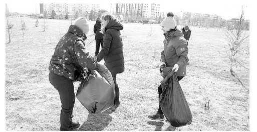
В Нижневартовском районе прошли традиционные субботники.