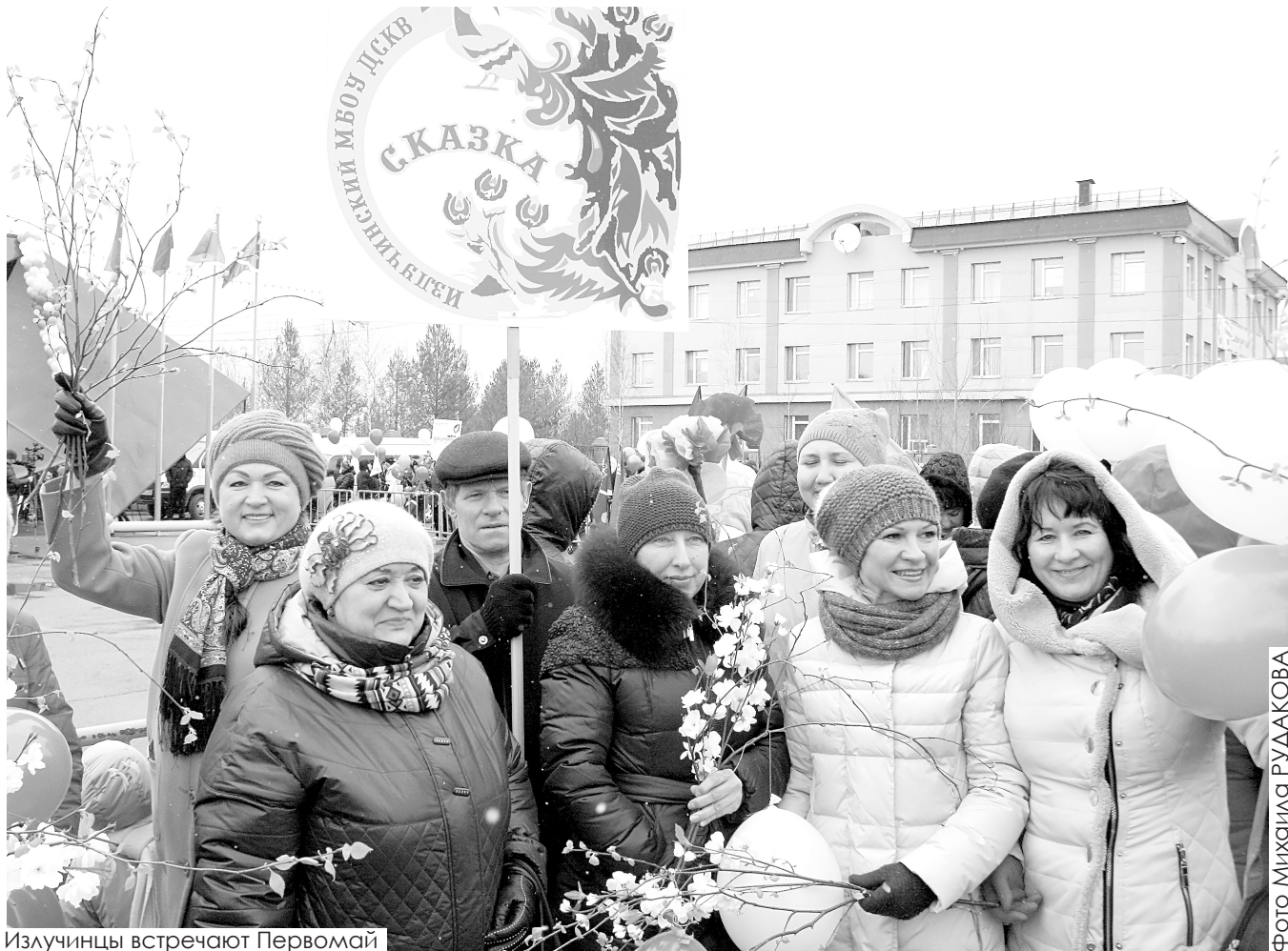
Излучинцы встречают Первомай