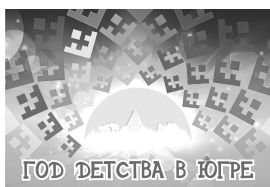
ГОД ДЕТСТВА В ЮГРЕ