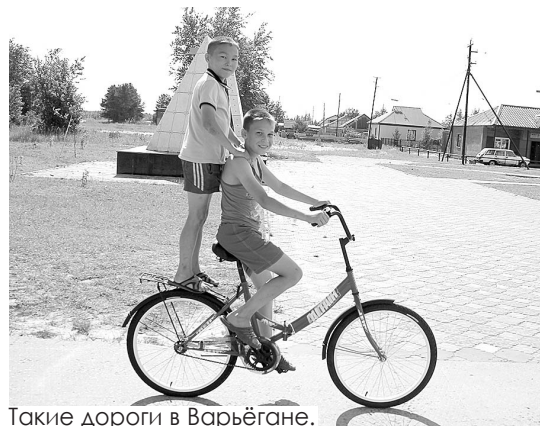
Такие дороги в Варьегане.