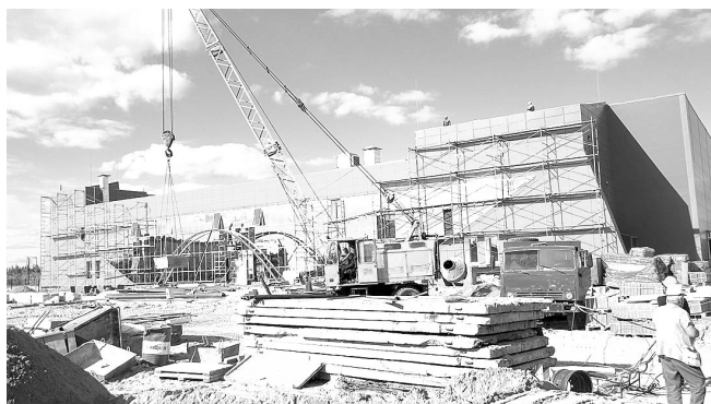
Самая масштабная стройка в районе. Ледовый каток.

Жильё не появляется само по себе – спрос на него формируют люди. При этом важна реальная возможность: смогут ли семьи с самым разным уровнем достатка вселиться в новый дом или квартиру? Поэтому помимо поддержки строительства с