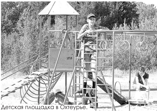
Детская площадка в Охтеурье.