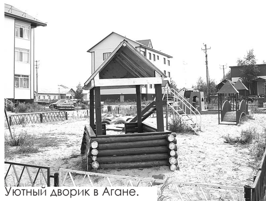
Уютный дворик в Агане.