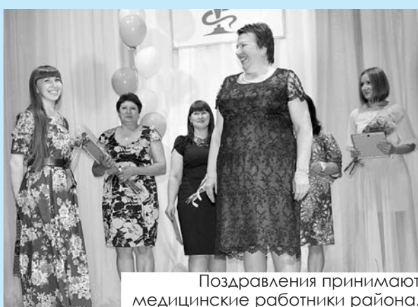
Поздравления принимают медицинские работники района.