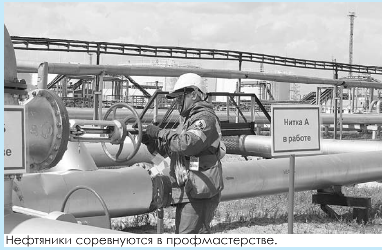
Нефтяники соревнуются в профмастерстве.