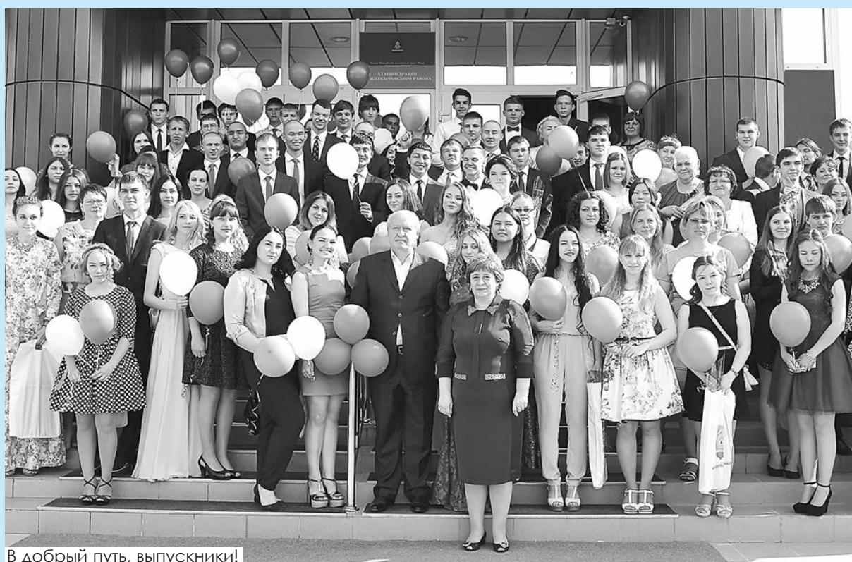
В добрый путь, выпускники!