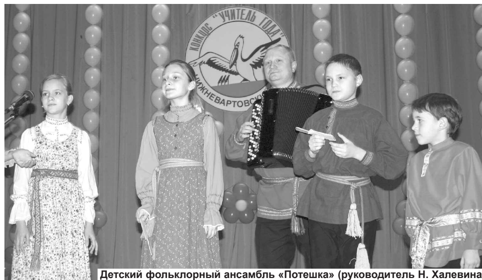
Детский фольклорный ансамбль «Потешка» (руководитель Н. Халевина).