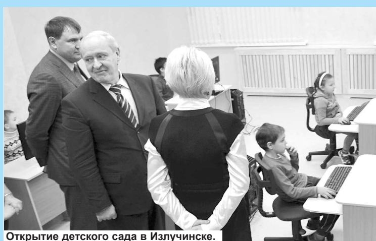
Открытие детского сада в Излучинске.