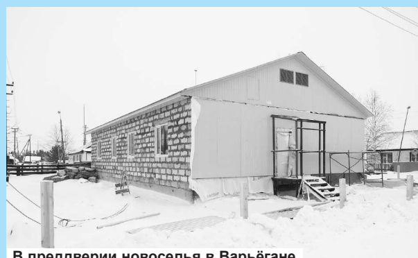
В преддверии новоселья в Варьегане.