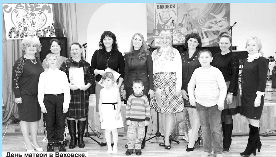
День матери в Ваховске.