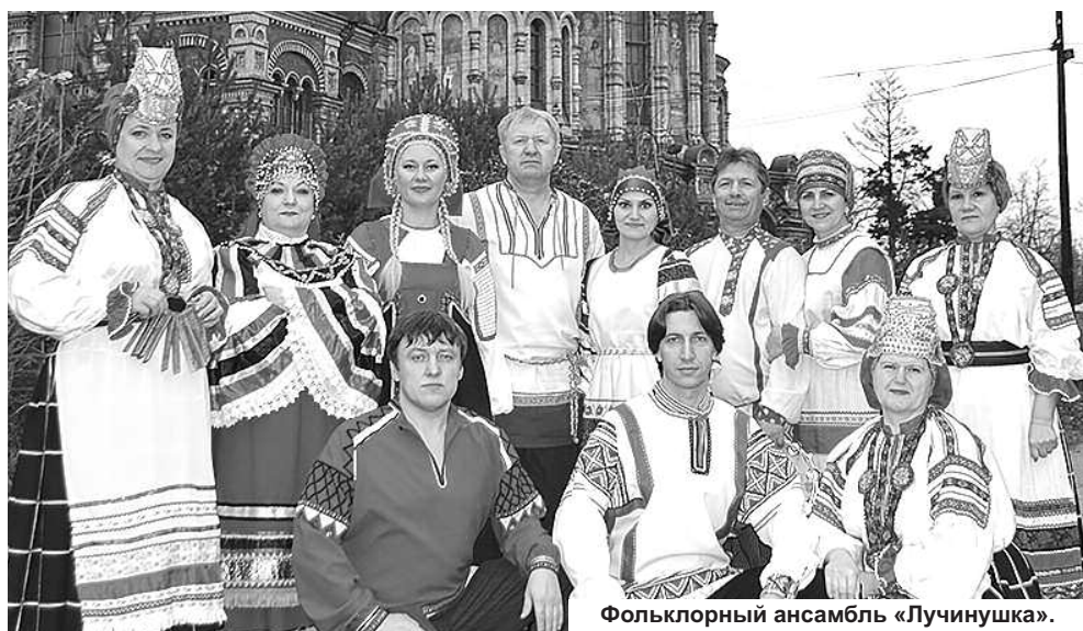
Фольклорный ансамбль «Лучинушка».

В фестивале приняли участие более пятидесяти коллективов из Болгарии, Эстонии, Литвы, Кипра, Ирана, Малайзии, Индонезии. География российских участников также обширна: Санкт-Петербург, Ленинградская и Московская области, Якутия, Мурманск, Печёра, Тверь, Уфа, Казань. А наш Нижневартовский район выпала честь представлять «Лучинушку». Два серебряных кубка и два диплома лауреата II степени в номинации «Ансамбль» и «Дуэт» привёз ансамбль после этого потрясающего фестиваля. Именно такое, потрясающее, впечатление произвёл фестиваль и культурная столица России на всех участников коллектива. Но сам ансамбль «Лучинушка» не менее впечатлил своим талантом и самобытностью именитое международное жюри. Во время конкурсной программы на фоне профессиональных коллективов из университетов, консерваторий и музыкальных училищ самодеятельный ансамбль из Новоаганска выглядел достойно и заставил сильно поволноваться конкурентов-профессионалов.