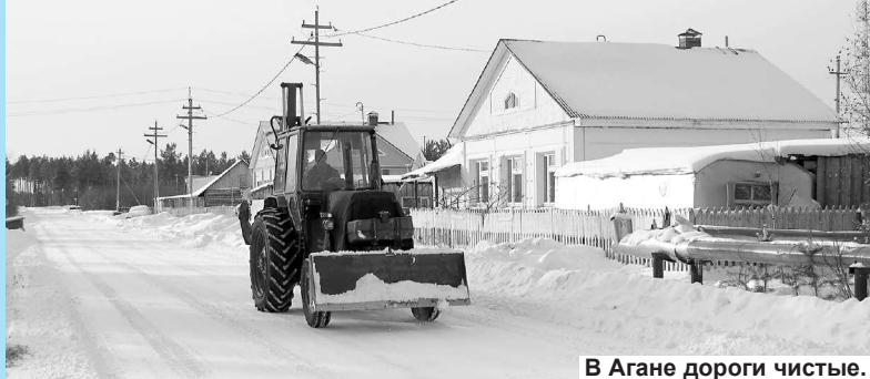
В Агане дороги чистые.