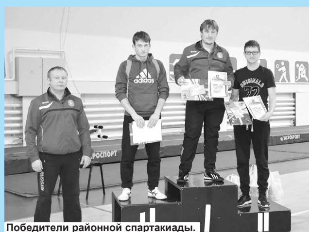
Победители районной спартакиады.