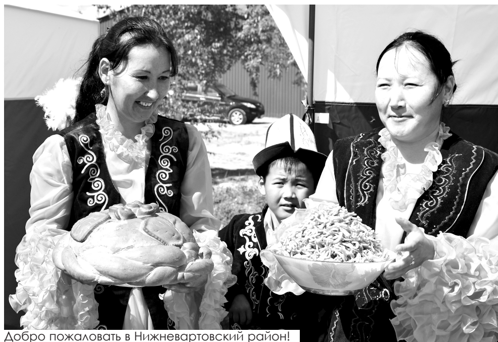
Добро пожаловать в Нижневартовский район!

«По всем вопросам приняты решения, которые мы совместно с обще-