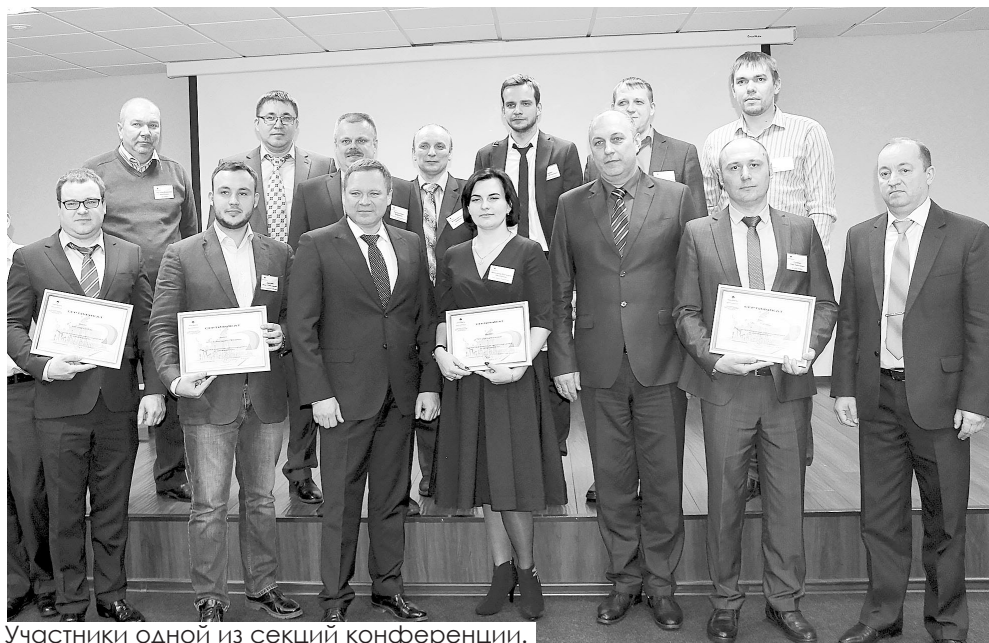
Участники одной из секций конференции.

Основными целями конференции стали стремление группы предприятий «Варьёганнефтегаз» повысить эффективность производства за счёт