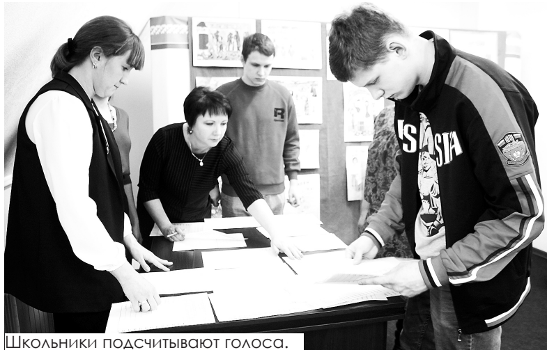
Школьники подсчитывают голоса.

Старшеклассники Излучинска попробовали себя в роли избирателей. В администрации городского поселения прошёл день открытых дверей для молодых избирателей, организованный Территориальной избирательной комиссией района.