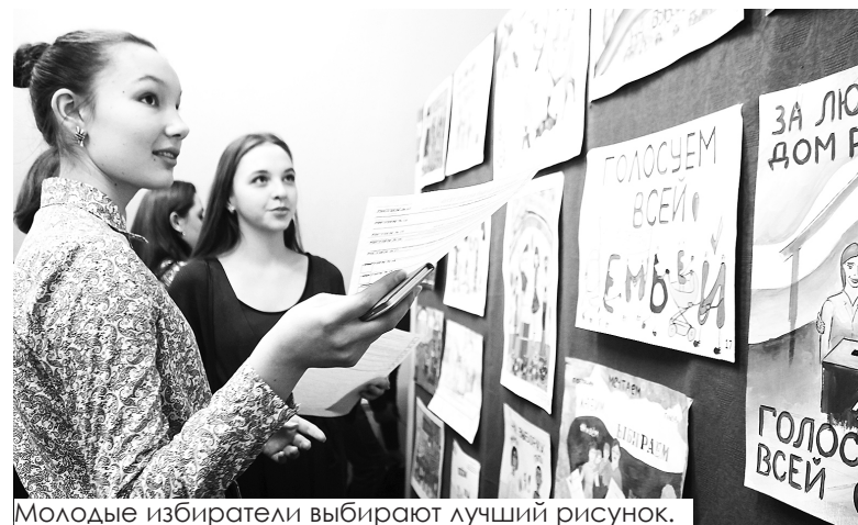
Молодые избиратели выбирают лучший рисунок.