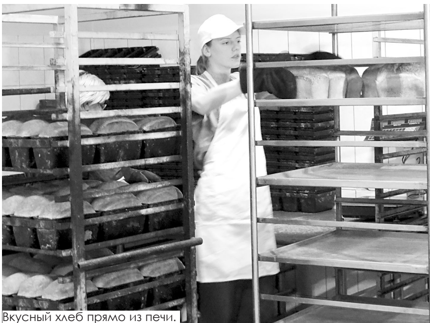
Вкусный хлеб прямо из печи.

Сначала встретились с главой сельского поселения Зоей Бахаревой, которая ввела нас в курс дела: