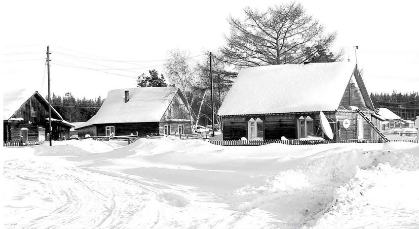
Нештатных ситуаций и сбоев в работе систем жизнеобеспечения сельского поселения Ларьяк в период низких температур не произошло.