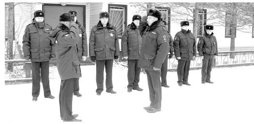
Наш корреспондент провела один день в отделении полиции.