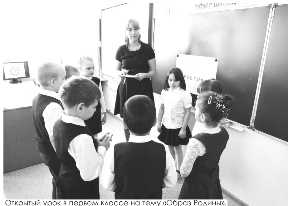
Открытый урок в первом классе на тему «Образ Родины».