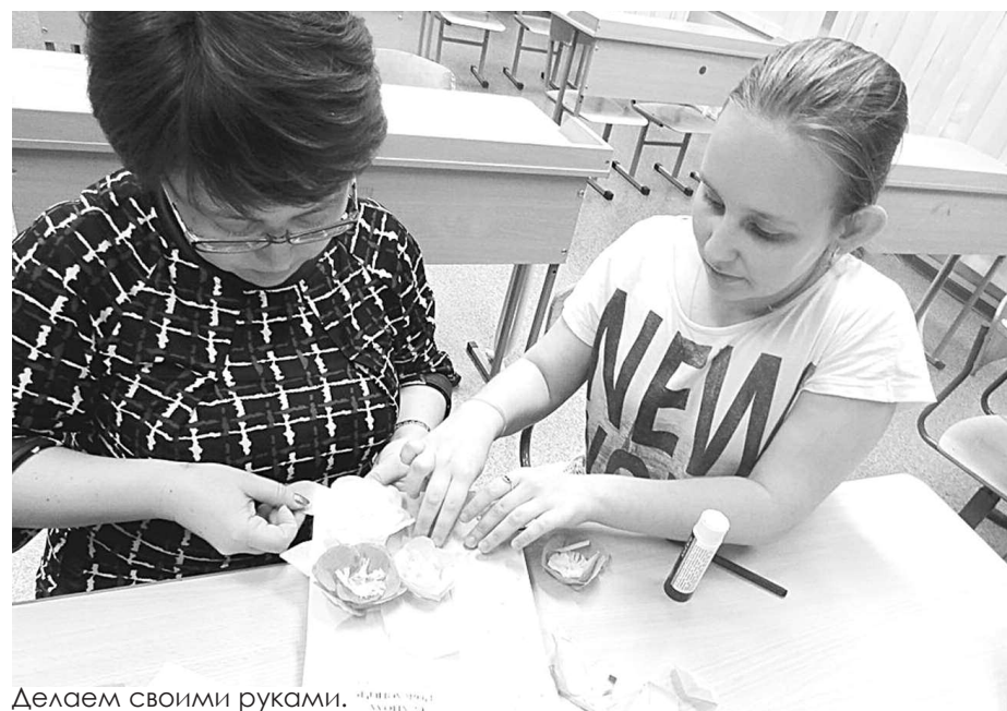
Делаем своими руками.