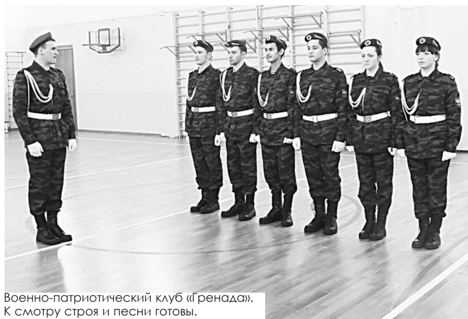
Военно-патриотический клуб «Гренада». К смотрю строя и песни готовы.