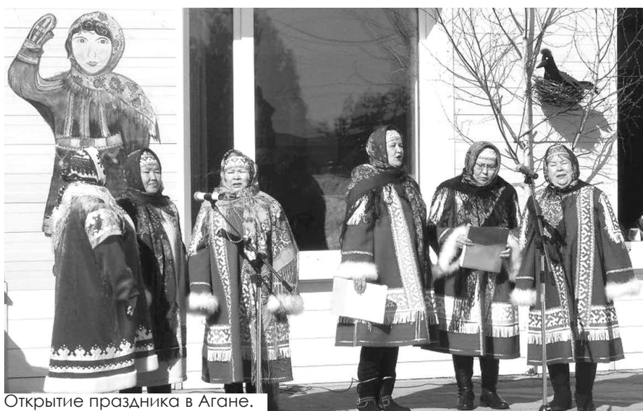
Открытие праздника в Агане.