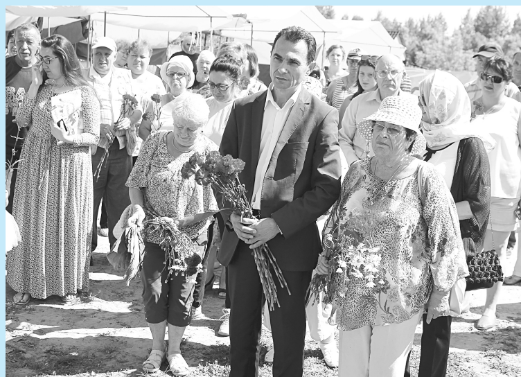
На праздновании 100-летнего юбилея деревни Соснина.