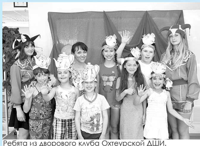
Ребята из дворового клуба Охтеурской ДШИ.