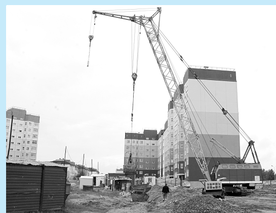
Строительство жилого дома в Излучинске.