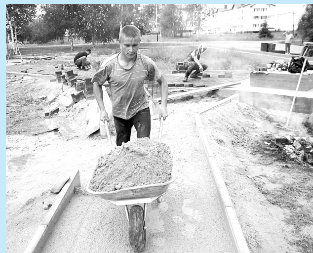
В Ваховске будет сквер.