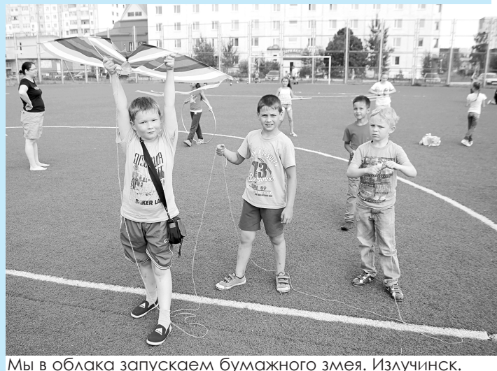
Мы в облака запускаем бумажного змея. Излучинск.