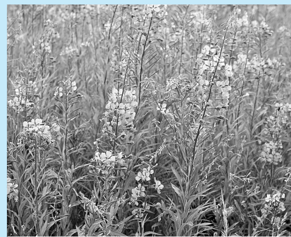
Пришло время иван-чая.