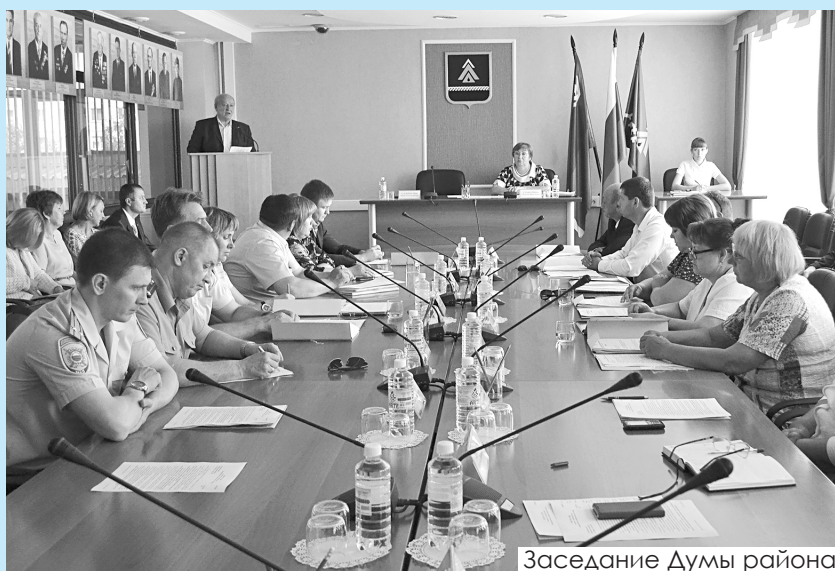
Заседание Думы района.