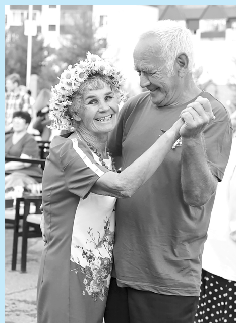
День семьи, любви и верности в Излучинске.