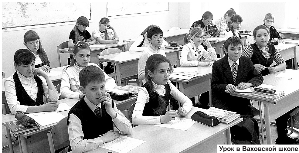
Урок в Ваховской школе.

На прошлой неделе состоялось первое заседание муниципального совета по развитию образования в Нижневартовском районе, на котором был рассмотрен ряд многогранных вопросов, касающихся не только сферы образования. Это экономика района, проведение ЕГЭ, гражданско-патриотическое воспитание, организация питания, исполнение муниципального контракта и другие.