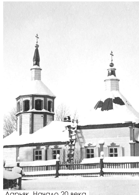
Ларьяк. Начало 20 века.

По итогам встречи договорились, что уже сегодня специалисты внесут изменения в эскизы будущей церкви, которые в ближайшее время будут согласованы с митрополитом Ханты-Мансийским и Сургутским Павлом. Подрядчики уже готовы приступить к работам по возведению фундамента. Он будет монолитный, железобетонный. Достоинств и преимуществ у монолитного основания много, в том числе прочность и способность выдерживать большие нагрузки. В целом, расчёты специалистов пока-