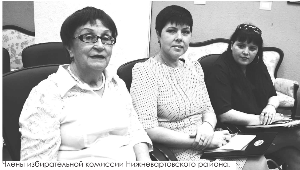
Члены избирательной комиссии Нижневартовского района.

Озвученная позиция партии власти заключается в следующем: пусть будет меньший у неё процент голосов,