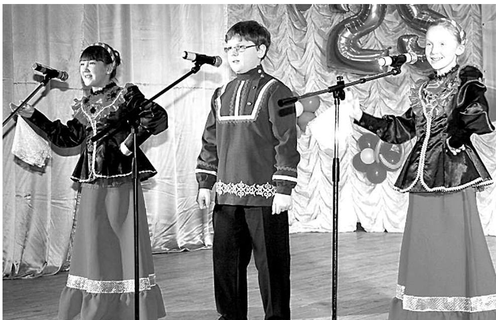
Ансамбль народной песни «Теремок».

Немного на свете городов, которые могут сравниться с Тобольском по величию и красоте, по масштабу личностей знаменитых людей, живших и творивших на этой благодатной земле. Тобольск – город уникальный, история веков переплелась в нём через многие национальности. Традиции и культура города настолько специфичны, настолько разнообразны и многоплановы, что здесь, на этой древней земле, пропитанной высокой духовностью, просто не мог не родиться такой фестиваль детского и юношеского творчества, как «Золотые купола».