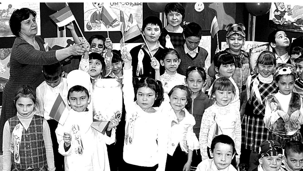
Выборы в сказочную Думу, п. Аган.

– Помимо обучения и постоянного повышения своего профессионального уровня, участковые избирательные комиссии приступили к участию в организации и проведении мероприятий по повышению правовой культуры граждан, в том числе молодых и будущих избирателей на территориях городских и сельских поселений. Эта работа ведётся в тесном взаимодействии с администрациями поселений, учреждениями и организациями культуры, образования и молодёжной политики.