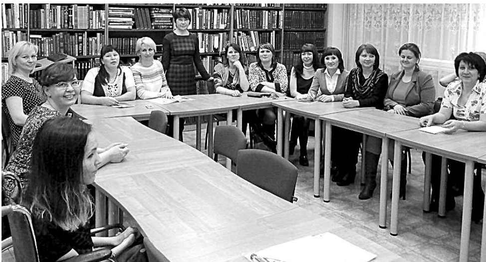
Обучение членов УИК, г.п. Излучинск.

– Чем ознаменован прошедший год для участковых комиссий района, сформированных на постоянной основе?