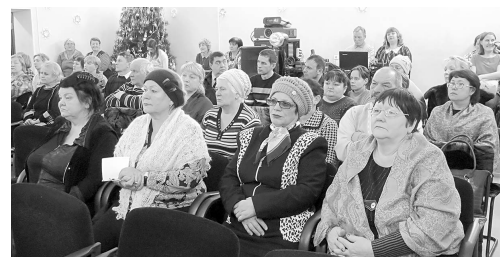
В сельском поселении Покур состоялся сход граждан.