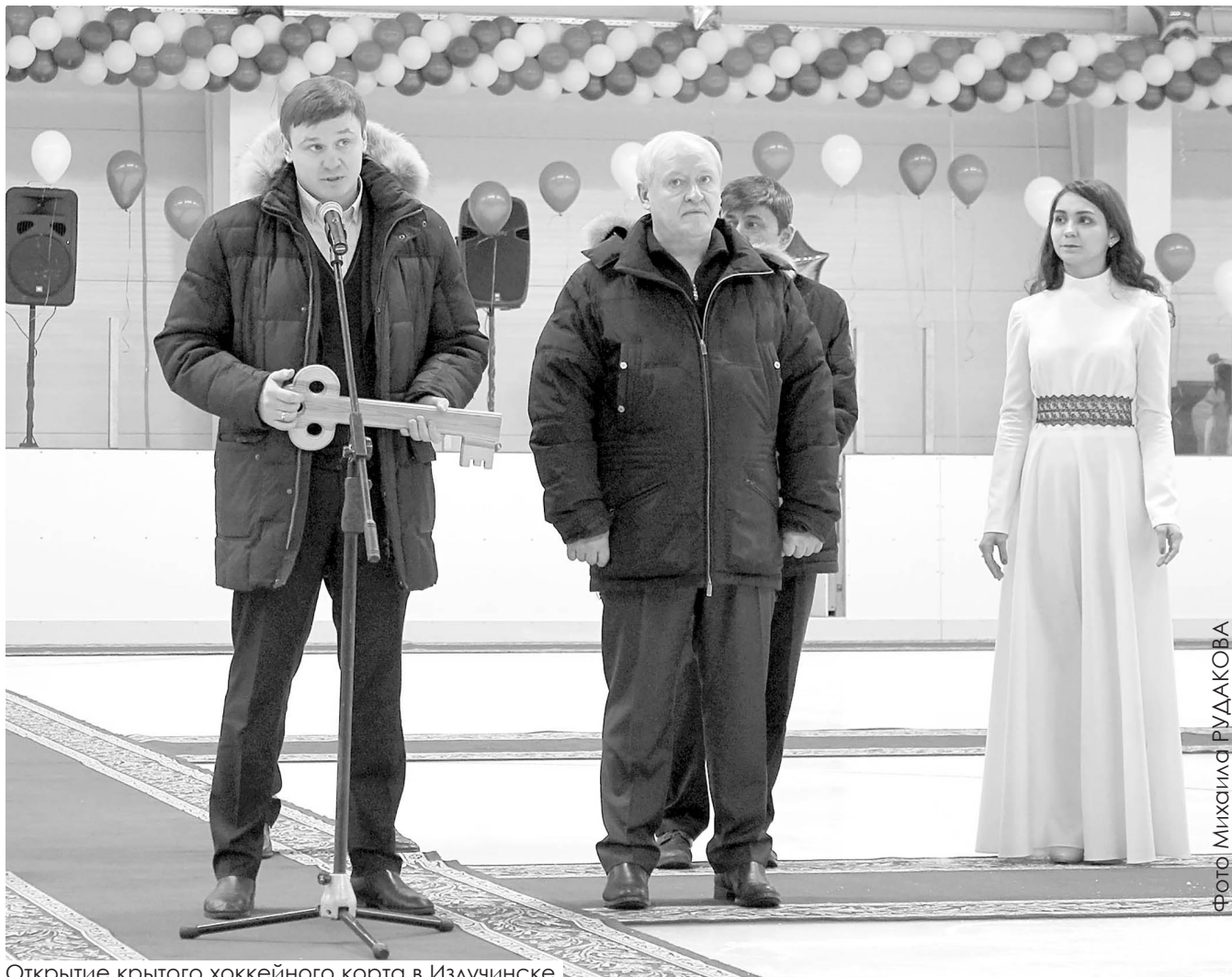
Открытие крытого хоккейного корта в Излучинске