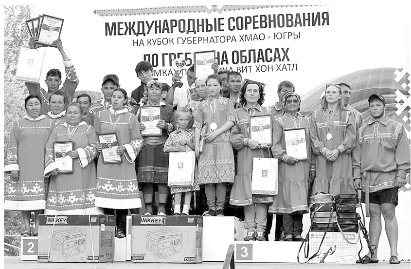
МЕЖДУНАРОДНЫЕ СОРЕВНОВАНИЯ НА КУБОК ГУБЕРНАТОРА ХМАО - ЮГРЫ