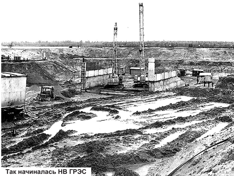
Так начиналась НВ ГРЭС

Для того, чтобы начать строительство конкретного объекта, необходимо было подготовить площадку, то есть произвести отсыпку грунта, спланировать, вывести соответствующие отметки, подготовить подъездные пути, а это ещё тысячи кубометров песка, щебня, дорожных плит. И здесь хочется особо остановиться на двух подразделениях – автотранспортном предприятии (АТП УС НВ ГРЭС) и управлении