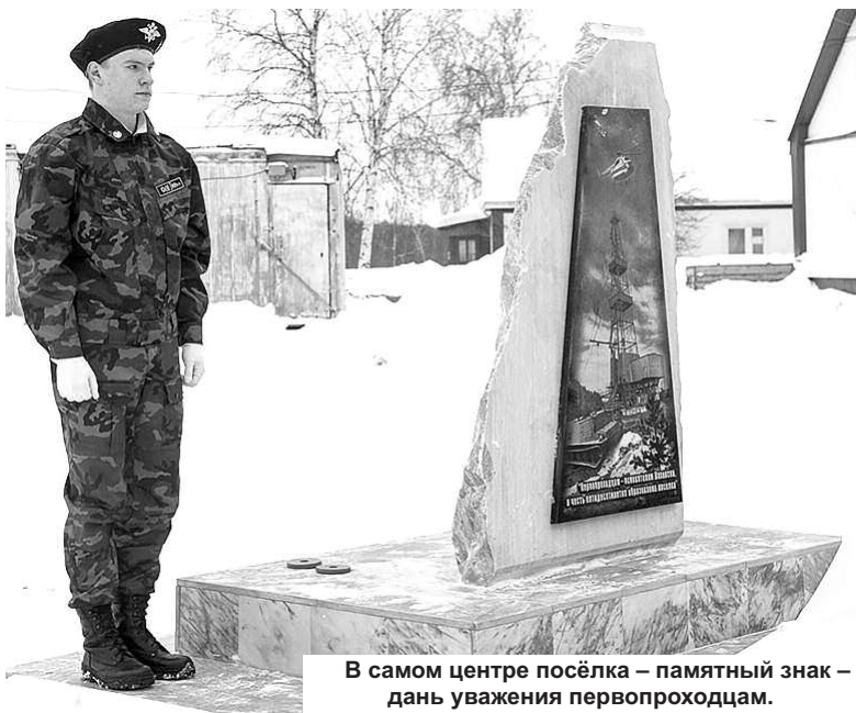
В самом центре посёлка – памятный знак – дань уважения первопроходцам.

час можно в тапочках везде ходить, вот и сравнивайте».