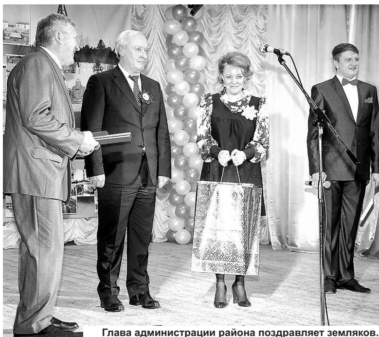
Глава администрации района поздравляет земляков.