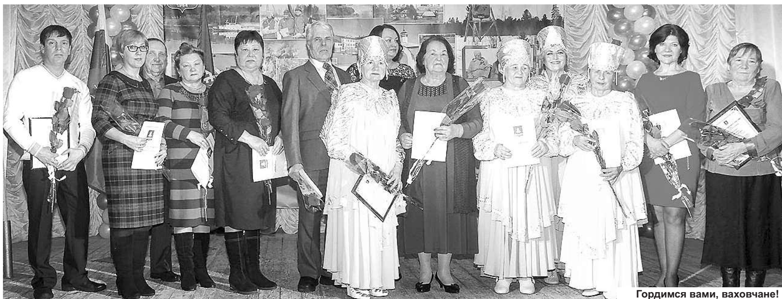
Гордимся вами, ваховчане!

За прошедшие со дня основания посёлка полвека сложилась целая история. И вся она была отражена на фотовыставке «Ваховск: вчера, сегодня, завтра». Первая свадьба, будни первопроходцев, народные гуляния и торжественные собрания в сельском клубе. Сотни снимков, а на них прошлое, на-