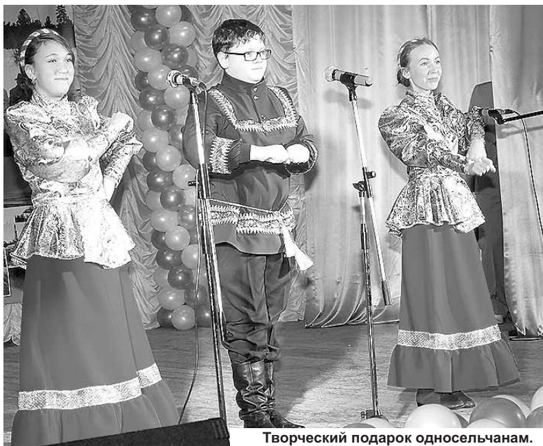
Творческий подарок односельчанам.

За последние пять лет в посёлке построено 8 тысяч квадратных метров жилья, 115 семей отметили новоселье, родился 91 ребёнок. Также сейчас здесь работает современная амбулатория, воз-