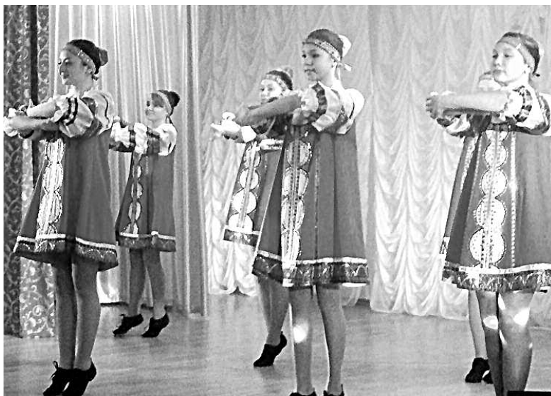
Концерт ко дню инвалидов в ДШИ им. А.В. Ливна.

Данные мероприятия позволяют направить внимание общества на преимущества, которые оно получает от участия инвалидов в социальной, политической, экономической и культурной жизни. Тем самым повышается уровень информированности