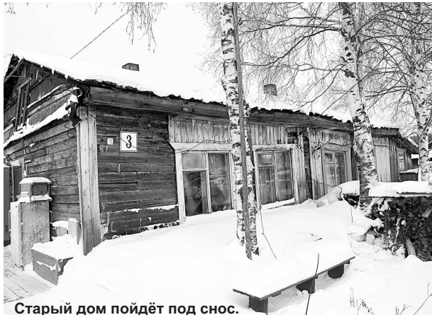
Старый дом пойдёт под снос.

Последние 4 года перед пенсией (на которую ушёл в 1990 году) я по столлярной части работал – с флота к тому времени уже ушёл по собственному желанию. Домашним хозяйством занимался. Держали коров, свиней и овец до 1998 года. В тот год мне операцию тяжёлую на позвоночнике сделали, и от живности пришлось отказаться. Сена заготавливали много, тех-