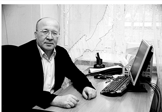
Уважаемые водители Нижневартовского района!

Наибольшую опасность на дорогах представляет машина, которая едет быстрее, чем способен думать её водитель. Роберт ЛЕМБКЕ.